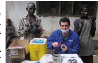
Baguage d'oiseau