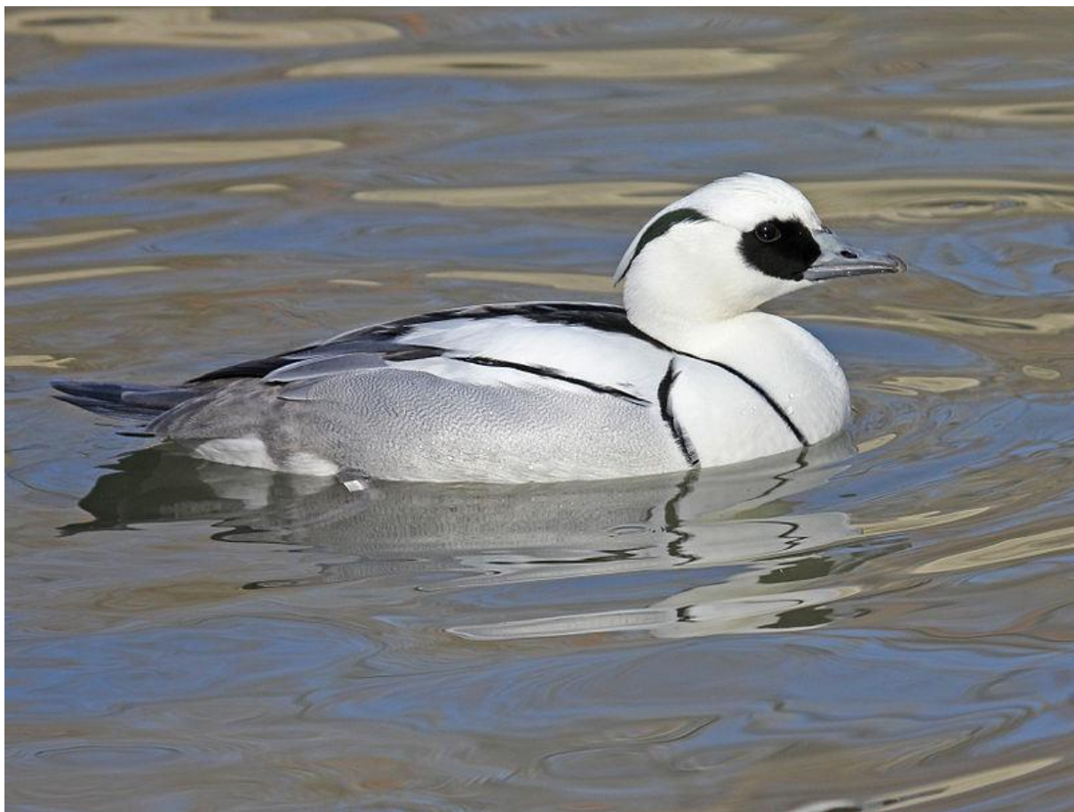
Smew / Harle piette / ( Mergellus albellus )

Excursion en Basse-Rhénanie, vendredi 13 novembre 2015